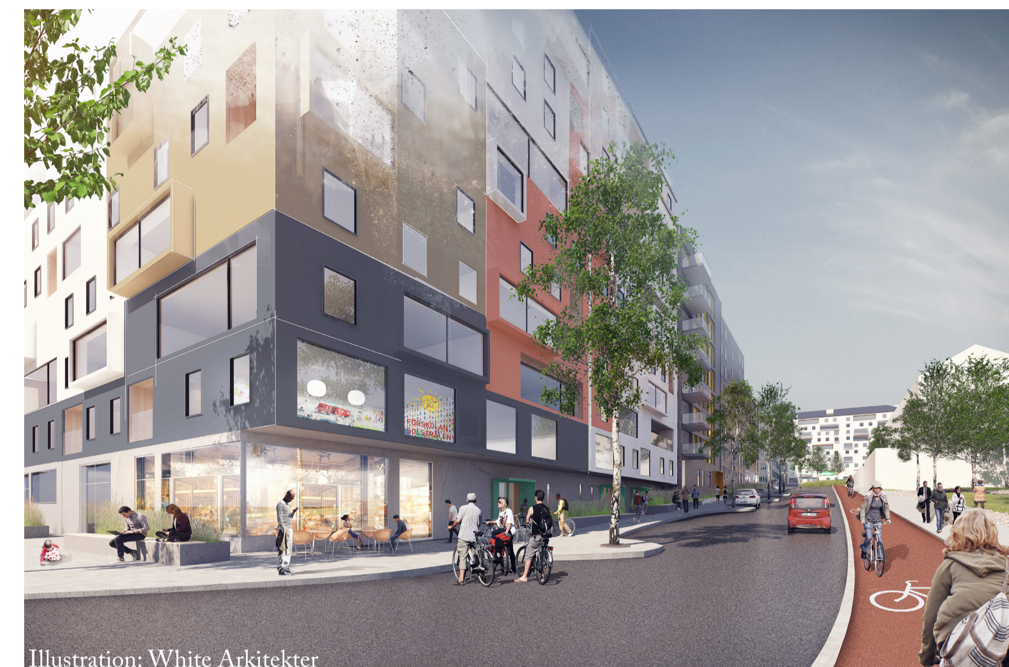
Illustration: White Arkitekter